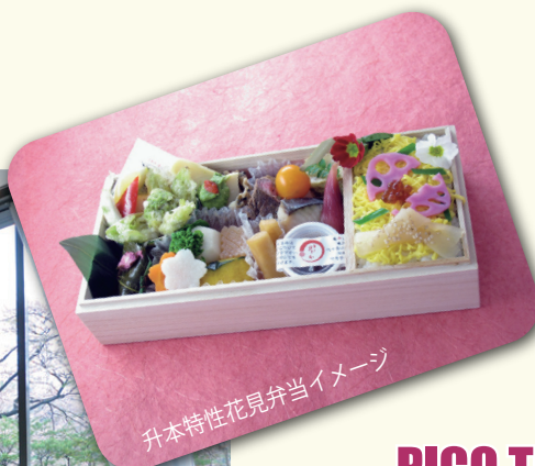
升本特性花見弁当イメージ