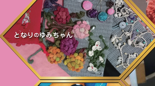
となりのゆみちゃん