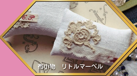
布小物 リトルマーベル