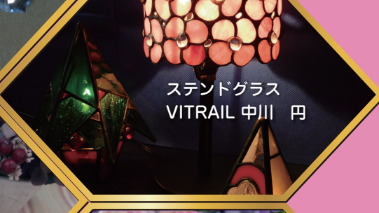
ステンドグラス VITRIL 中川 円