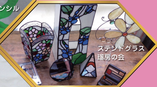
ステンドグラス 瑠房の会