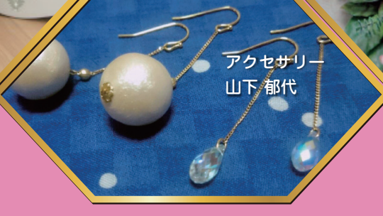
アクセサリー 山下 郁代