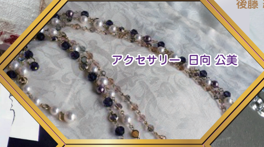
アクセサリー→ 日向 公美