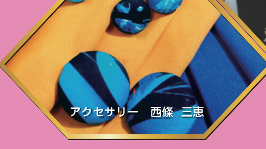
アクセサリー 西條 三恵