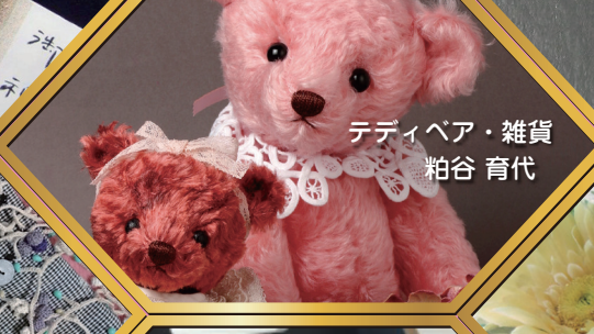
ディベア・雑貨 粕谷 育代