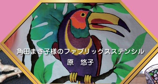
角田まさ子様のファブリックステンシル 原 悠子