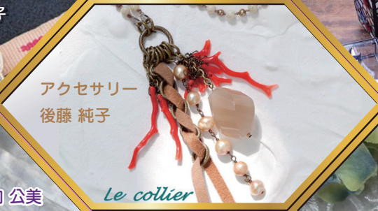
アクセサリー 後藤 純子