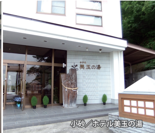
小砂/ホテル美玉の湯