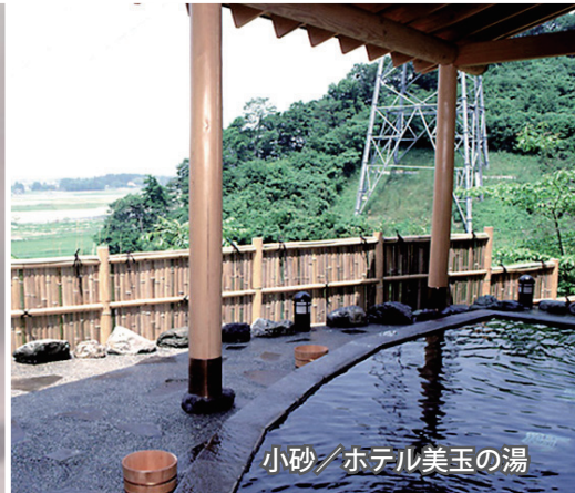
小砂/ホテル美玉の湯